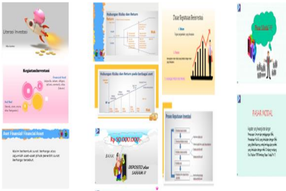
Gambar 6 : Contoh Pemaparan Perencanaan Keuangan dan Modal