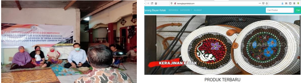
Gambar 5. A. Proses pelatihan. B. Tampilan Website Jualan

Dengan adanya pelatihan ini mitra terjadi peningkatan pemahaman dan keterampilan dalam membuat media promosi dan strategi pemasaran, dihasilkan model media promosi baik cetak maupun media di Internet, meningkatkan pemahaman dan keterampilan mitra dalam mengembangkan jaringan usaha baik untuk kepentingan pendanaan, produksi maupun pemasaran dan dihasilkan blog peasaran dengan alamat http://karangbayanketak.com untuk media promosi yang lebih komprehensif dan intensif untuk kegiatan pemasaran. Adapun dokumen kegiatan pelatihan manajemen pemasaran disajikan dalam gambar dibawa ini :