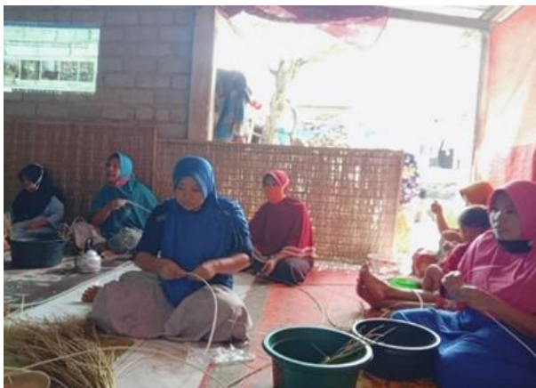
Gambar 4. Pelatihan manajemen Produksi

Dengan adanya pelatihan ini, keterampilan pengerajin meningkat hal ini dapat dilihat dari hasil produksi baik secara kuantitas maupun kualitas. Dari sisi kuantitas sebelum diadakan pelatihan pengerajin hanya mampu menghasilkan 1 produk ketak kecil dalam angka waktu 3 sampai 4 hari akan tetapi setelah diadakan pelatihan dapat dikerjakan dalam waktu kurang dari 2 hari. Sedangkan dari sisi kualitas dapat dilihat dari kemampuan pengerajin menghasilkan produk kerajinan ketak yang diminati oleh konsumen. Adapun kegiatan pelatihan manajemen produksi disajikan dalam gambar dibawa ini :