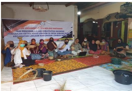
Gambar 6. Kegiatan Perencanaan Bisnis dan Motivasi Jualan

Dengan adanya pelatihan ini mitra memiliki pemahaman tentang membuat perencanaan bisnis ( bussines plan ) serta dihasilkan dokumen perencanaan bisnis sebagai rencana pengembangan usaha baik dalam jangka pendek, jangka menengah dan jangka panjang. Sedangkan pelatihan Motivasi Bisnis dapat meningkatkan peran kelompok pengrajin anyaman ketak khas Lombok "Nusa Indah" sebagai pusat kegiatan kewirausahaan kerajinan ketak khas Lombok minimal untuk tingkat Desa. Adapun kegiatan pelatihan Perencanaan Bisnis dan Motivasi Bisnis disajikan dalam gambar dibawa ini :