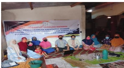
Gambar 2. Pelatihan Manajemen SDM

Pelatihan manajemen SDM yang dilakukan berjalan dengan baik. Adapun hasil kegiatan pelatihan antara lain, 1) mitra memahami dengan baik penempatan anggota dalam struktur 2) pembagian tugas dan kewenangan dalam menjalankan bisnis. Selain pemahaman itra juga telah membuat struktur organisasi yang baku dalam menjalankan dan membangun bisnis ekonomi kreatif Adapun kegiatan pelatihan manajemen organisasi disajikan dalam gambar dibawah ini :