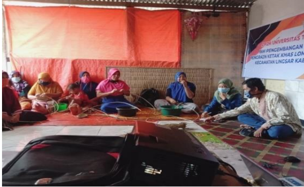
Gambar 3. Pelatihan manajemen keuangan

Permasalahan mitra dalam manajemen keuangan secara umum antara lain, 1) tidak melakukan pembukuan, penggunaan uang yang tidak terstruktur antara kegiatan usaha dan keperluan pribadi, tidak ada pelaporan dll, kondisi ini menjadi permasalahan yang akan diselesaikan melalui kegiatan pelatihan. Hasil kegiatan pelatihan menunjukkan adanya kesadaran dan peningkatan pemahaman mitra dalam pengelolaan keuangan, hal ini ditunjukkan dengan kemampuan mitra dalam membuat laporan keuangan sederhana seperti mampu membuat neraca dan laporan rugi laba. Adapun kegiatan pelatihan manajemen keuangan disajikan dalam gambar dibawa ini :