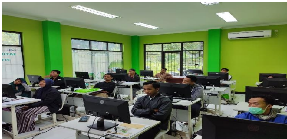
Gambar 4. Proses Penilaian & Evaluasi

Sesi Hari Ketiga : Tes Penilaian dan Evaluasi Diri, Tes penilaian dan evaluasi diri dilakukan dapat membantu siswa pelatihan untuk memahami lebih baik tentang dirinya sendiri, termasuk kekuatan dan kelemahan pribadi, sehingga dapat membantu dalam memperbaiki dan meningkatkan keterampilan, sikap, dan pengetahuan yang dimiliki terkhusus dalam pembuatan CV menggunakan Aplikasi Adobe Photoshop , Sesi Hari Ketiga dalam pengawasan pemateri : Reny Amalia Permata, M.Si.