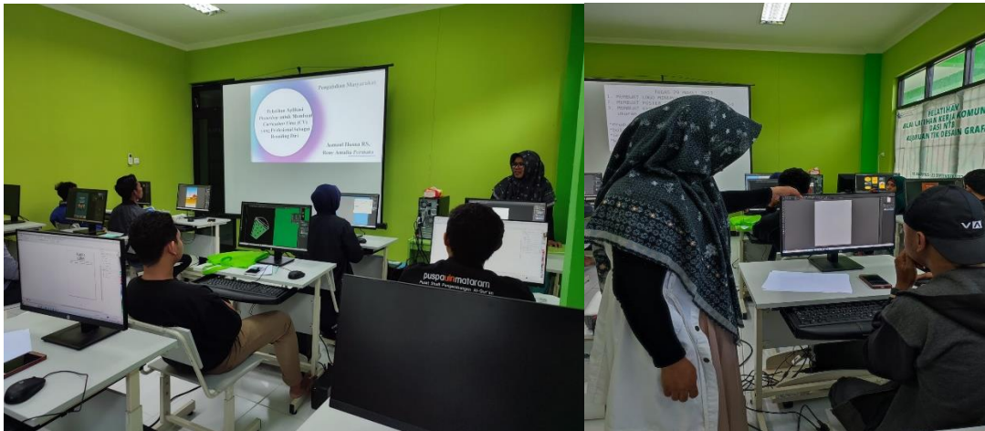
Gambar 3. Praktikum Langsung dan Diskusi

Sesi Hari Kedua : Praktikum Langsung dan Diskusi Kelompok dilaksanakan di ruangan praktek BLK Komunitas LAZ DASI NTB dengan metode siswa pelatihan membuat CV Profesional menggunakan Aplikasi Adobe Photoshop dan dilanjutkan dengan Rapat brainstorming dengan tujuan untuk menghasilkan gagasan atau ide baru dalam suatu topik atau masalah tertentu. Dalam rapat brainstorming , setiap siswa pelatihan diharapkan dapat memberikan kontribusi dan ide secara bebas tanpa ada batasan atau kritik terhadap ide yang diusulkan. Kegiatan pada sesi hari kedua di bawah bimbingan pemateri : Asmaul husna RS, MT.