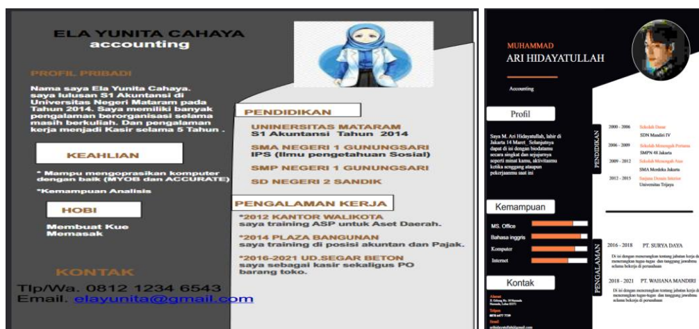
Gambar 5. Hasil Desain CV Siswa Pelatihan

Secara keseluruhan, pengabdian kepada masyarakat dalam bentuk pelatihan aplikasi Adobe Photoshop untuk membuat CV yang profesional sebagai branding diri memiliki dampak yang positif bagi masyarakat dan institusi pendidikan. Hal ini membantu meningkatkan keterampilan dan kualitas hidup masyarakat serta memperkuat keterikatan perguruan tinggi dengan masyarakat di sekitarnya. Luaran yang dihasilkan dari program Pengabdian Kepada Masyarakat (PKM) berupa hasil desain CV profesional siswa pelatihan yang dapat digunakan untuk mempersiapkan diri untuk terjun ke dunia kerja secara langsung.