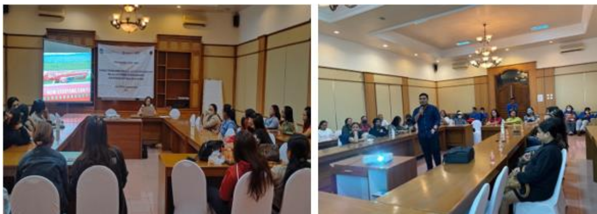
Gambar 3 Character Building Tahap 2 (Kegiatan I dan II)