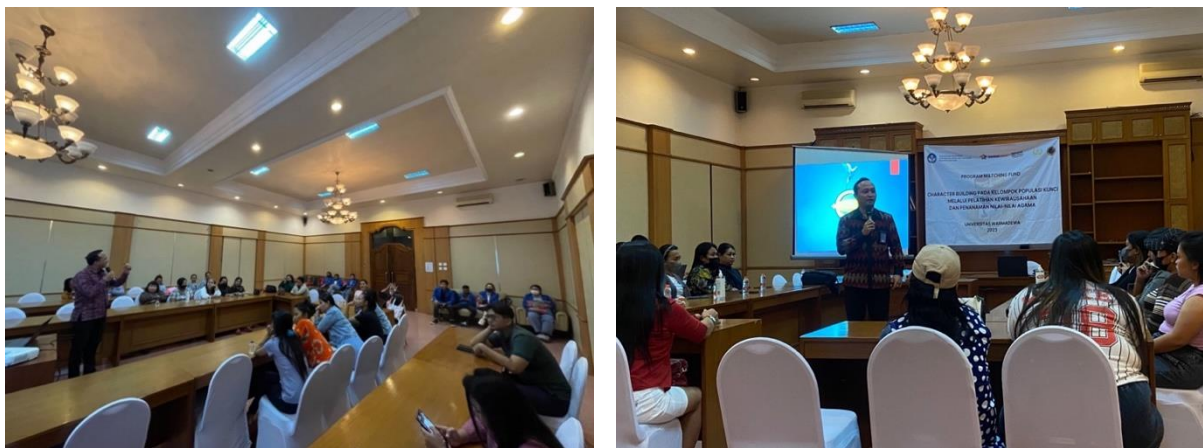
Gambar 2 Character Building Tahap 1 (Kegiatan I dan II)

Penanaman nilai-nilai agama dan pengembangan SDM membutuhkan dukungan finansial, fasilitas, dan sumber daya lainnya secara berkelanjutan sehingga kegiatan ini dapat secara rutin terlaksana. Kendala yang dihadapi dalam pelaksanaan kegiatan ini antara lain, ada satu peserta menghadapi kesulitan dalam mengakses lokasi pelatihan karena jarak tinggal yang jauh dan memiliki keterbatasan mobilitas sehingga harus menggunakan transportasi online, selain itu ada peserta mungkin tidak sepenuhnya menyadari manfaat yang dapat mereka peroleh dari kegiatan ini. Mereka mungkin merasa kurang termotivasi untuk mengubah sikap dan perilaku mereka, terutama jika mereka merasa kondisi mereka sudah terlalu sulit atau bahkan sudah terbiasa dengan situasi tersebut.