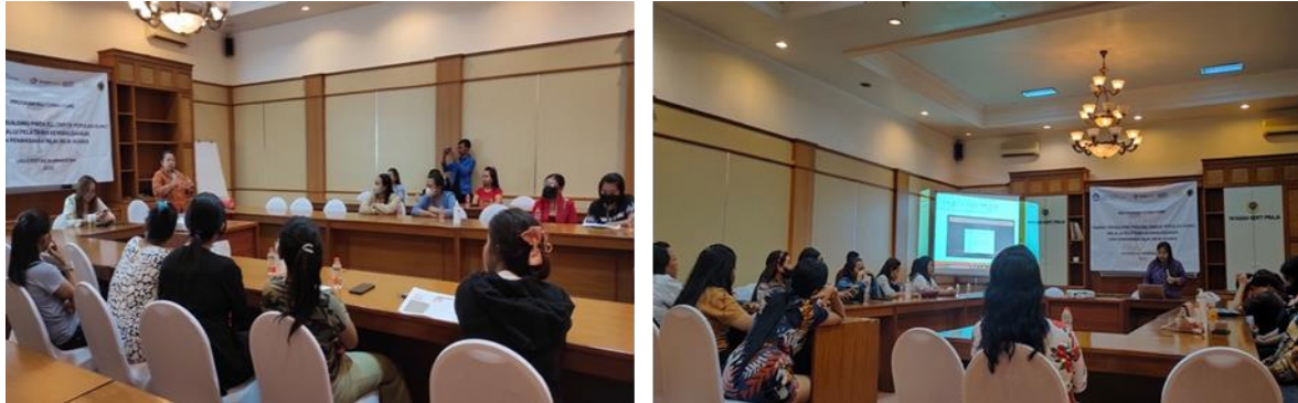
Gambar 5 Character Building Tahap 4 (Kegiatan I dan II)

Kendala yang dihadapi dalam pelaksanaan kegiatan ini adalah kurangnya pemahaman penggunaan teknologi dalam berwirausaha, namun ada beberapa peserta yang sudah melek teknologi khususnya dalam penggunaan media sosial. Sementara itu, praktek pembuatan minyak VCO terbatas pada presentasi dan pemaparan materi, sehingga keberlanjutan program diharapkan dapat dilaksanakan dengan proses pembuatan minyak VCO dengan alat. Pengenalan platform e-commerce memberikan inspirasi bagi peserta dalam memulai usaha secara online, disamping itu peserta tertarik dalam usaha pembuatan minyak VCO karena melihat prospek penjualan minyak VCO dengan harga yang tinggi.