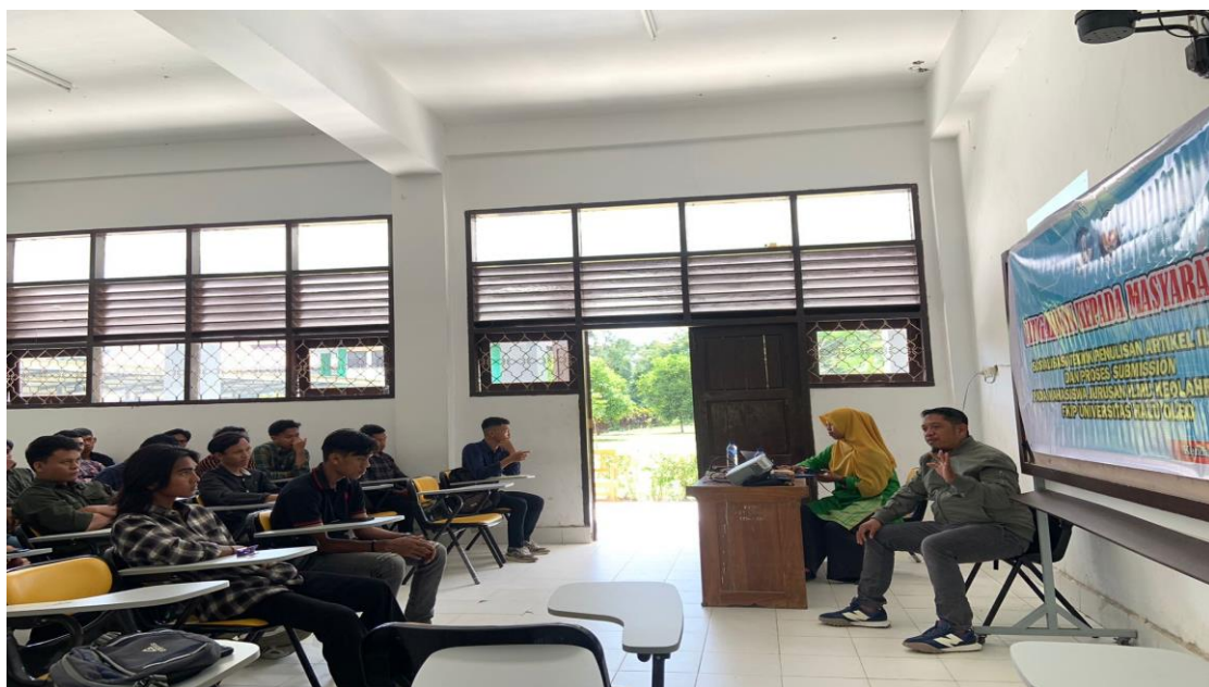
Gambar 1. Sambutan Pelaksanaan PKM Sosialisasi Teknik

Hasil pelaksanaan Pengabdian kepada Masyarakat (PKM) dalam bentuk sosialisasi teknik penulisan artikel ilmiah dan proses submission pada mahasiswa dilaksanakan pada tanggal 9 September 2023. Beberapa hasil yang dicapai melalui kegiatan PKM ini yaitu mahasiswa yang mengikuti sosialisasi ini akan memiliki pengetahuan yang lebih baik tentang teknik penulisan artikel ilmiah dan proses submission. Mereka akan memahami struktur, format, dan etika yang diperlukan dalam penulisan artikel ilmiah. Mahasiswa akan mengembangkan keterampilan penulisan yang lebih baik melalui pelatihan dan panduan yang mereka terima. Ini akan membantu mereka menjadi penulis yang lebih efektif dan terampil. Seiring dengan penulisan artikel ilmiah, mahasiswa juga akan meningkatkan kemampuan penelitian mereka. Mereka akan belajar cara merancang penelitian yang kuat, mengumpulkan data, dan menganalisis hasilnya. Mahasiswa akan diajarkan untuk berpikir secara kritis tentang sumber-sumber yang mereka gunakan dan bagaimana mereka mempresentasikan data mereka. Ini akan membantu mereka mengembangkan kemampuan berpikir analitis yang lebih baik.