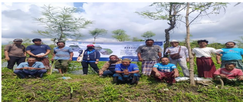
Gambar 7. Field day kunjungan tim pengabdian Universitas Mataram ke Montong Tekot desa Sukadana bersama Kelompok Tani “Patuh Bersama”