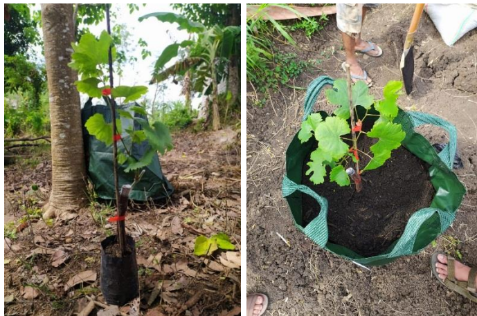
Gambar 4. Bibit tanaman anggur varietas Trans dan Ninel

Keberhasilan kegiatan pengabdian ini menggunakan metode Participatory Rural Appraisal (PRA) yang mana keberhasilan kegiatan diukur berdasarkan observasi keterlibatan anggota peserta yang terlibat dalam kegiatan pendampingan budidaya serta berhasilnya pertumbuhan vegetatif tanaman anggur selama masa pendampingan yang mana dianalisis secara deskriptif. Kegiatan pengabdian ini diharapkan adanya keberlanjutan program pemanfaatan lahan yang tidak produktif menjadi lebih produktif untuk budidaya tanaman hortikultura buah pada musim kemarau.