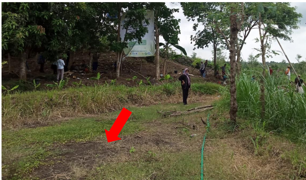
Gambar 2. Contoh lahan kosong yang tidak termanfaatkan saat musim kemarau di daerah Montong Tekot.

Berdasarkan hasil penelitian dan pengabdian Muttaqin et al. (2018) menunjukkan bahwa pemanfaatan lahan kosong dapat memenuhi ketahanan pangan masyarakat sekitar. Anggur merupakan salah satu tanaman hortikultura yang sama sekali belum mampu dan belum pernah dibudidayakan oleh masyarakat tani di Montong Tekot. Tanaman anggur juga suka dengan tanah yang kering dan tidak memerlukan terlalu banyak air. Oleh karena itu, pemberdayaan kelompok tani dalam budidaya tanaman ini sangat relevan dengan kondisi daerah lahan kering yang memiliki intensitas matahari yang tinggi dan udara kering dalam memenuhi kebutuhan pariwisata serta masyarakat sekitar di KEK Mandalika.