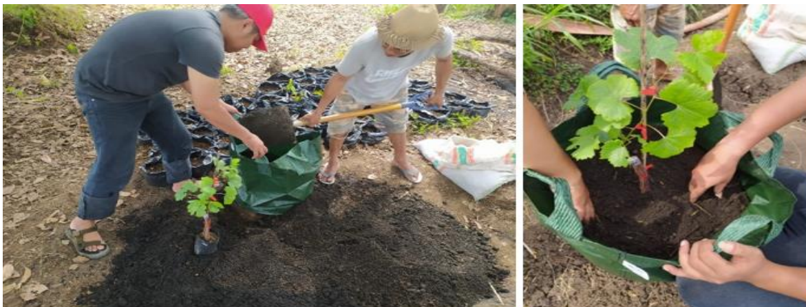
Gambar 5. Pengolahan media tanam dan penanaman bibit tanaman anggur

Kegiatan pendampingan budidaya tanaman anggur ini dilakukan secara terkontrol oleh tim pelaksana kepada Kelompok Tani “Patuh Bersama” selama tiga bulan mulai November 2022 hingga Januari 2023. Pendampingan dimulai dengan langsung mempraktekkan sekaligus menjelaskan cara dan teknik dalam budidaya tanaman anggur di lahan kering. Karakteristik tanah di daerah Montong Tekot yang tergolong sebagian besar adalah tanah liat membuat pertumbuhan akar tanaman hortikultura buah seperti tanaman anggur agak sulit berkembang ketika musim kemarau. Oleh karena itu, pengolahan dan modifikasi media tanaman pada pengabdian ini sangat penting dilakukan. Salah satu modifikasi media tanam yang dilakukan adalah dengan menggunakan planter bag dengan campuran media tanam yang terdiri dari tanah urug pilihan, pasir, dan biochar dengan perbandingan 1:1:1. Selanjutnya, permukaan atas media ditaburi dengan pupuk kandang dari kotoran kambing (Gambar 5).