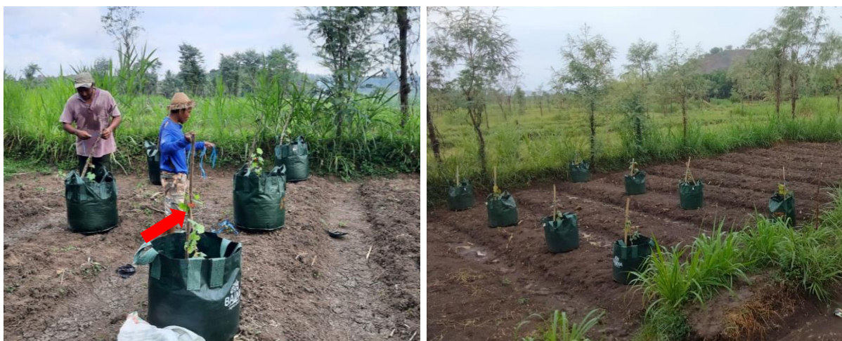
Gambar 6. Pertumbuhan vegetatif tanaman anggur yang sedang diberi penyangga dari ajir kayu dan bambu. Panah merah: sulur tanaman yang sedang berkembang

Selama tiga bulan pertumbuhan tanaman anggur menunjukkan hasil yang memuaskan yang ditandai dengan bertambah tingginya tanaman dengan rata-rata lebih dari 50 cm dan berkembangnya sulur tanaman (Gambar 6). Salah satu indikasi ini menunjukkan bahwa tanaman anggur dapat tumbuh di daerah kering beriklim kering. Hal ini juga didukung oleh media tanam yang digunakan merupakan kombinasi dari tanah urug pilihan, pasir, biochar, dan pupuk kandang yang dapat mempertahankan kandungan air tanah selama pertumbuhan vegetatif tanaman. Selain itu, peran pemupukan dan perawatan tanaman sangat besar dalam menjaga ketahanan tanaman dari kekurangan nutrisi dan cekaman lingkungan.