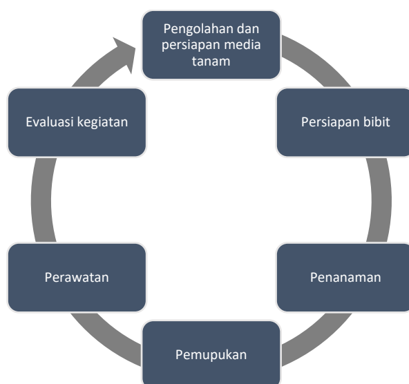
Gambar 3. Bagan alir tahapan kegiatan pendampingan budidaya tanaman hortikultura buah

Kegiatan pengabdian ini dilakukan pada bulan November 2022 hingga Januari 2023 kepada mitra kelompok tani “Patuh Bersama” di dusun Montong Tekot, desa Sukadana, kecamatan Pujut, kabupaten Lombok Tengah. Tahap paling awal dari seluruh rangkaian kegiatan ini adalah koordinasi dengan berbagai pihak mulai dari Kelada desa, mitra kelompok tani, pemerintah daerah, dan pihak Indonesia Tourism Development Corporation (ITDC). Pendampingan budidaya tanaman anggur dalam kegiatan pengabdian ini dilakukan menggunakan metode partisipatif dari anggota kelompok tani yang ikut terlibat. Peserta dari anggota kelompok tani berperan aktif dalam mengikuti pendampingan budidaya anggur mulai dari (1) pengolahan dan persiapan media tanam, (2) persiapan bibit, (3) penanaman, hingga (4) pemupukan serta (5) perawatan dan diakhiri dengan (6) evaluasi kegiatan setelah pelaksanaan pengabdian. Tahapan yang dilakukan dalam pendampingan budidaya tanaman anggur dapat dilihat pada diagram berikut (Gambar 3).