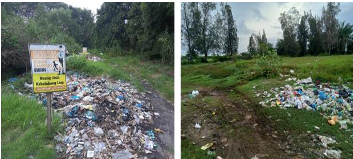
Gambar.1 Survei Lingkungan Gampong Paloh Lada

Survei awal yang dilakukan oleh tim pengabdian kepada masyarakat di Gampong Paloh Lada menemukan bahwa desa paloh lada memiliki permasalahan pengelolaan sampah rumah tangga yang belum maksimal. Sampah menjadi persoalan utama yang di hadapai oleh warga sekitar Gampong Paloh Lada Kecamatan Dewantara Kabupaten Aceh Utara. Geucik/Kepala desa Gampong Paloh Lada Tgk. Razali mengungkapkan bahwa sampah atau limbah rumah tangga yang semakin meningkat dan tidak terkelola dengan baik menjadi permasalahan yang paling utama yang harus di selesaikan dalam waktu dekat. Upaya gampong untuk menangani permasalahan sampah sudah dilakukan secara maksimal dengan menyediakan bak sampah dan meminta bantuan ke pemerintah kabupaten Aceh Utara terkait dengan permasalahan sampah. Hanya saja hal ini ternyata tidak dapat berjalan dengan maksimal dan efisien karena terlalu banyaknya sampah/limbah rumah tangga yang di hasilkan setiap harinya.