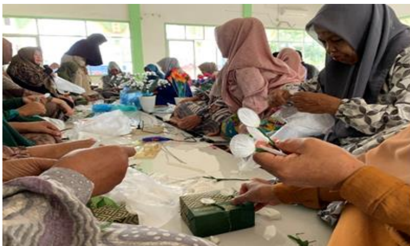
Gambar. 4 Foto Kegiatan Pengabdian di gampong paloh Lada