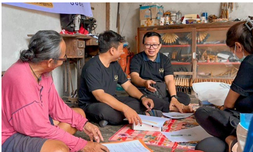
Gambar 1. Sosialisasi terkait tata cara pencatatan kas masuk dan kas keluar serta penyusunan laporan keuangan serta pemberian pre-test.

Pertama, pengelolaan keuangan. Sebelum program, para pengrajin mengalami kesulitan dalam menyusun laporan keuangan sederhana seperti laporan posisi keuangan dan laporan laba rugi. Hal ini menyebabkan mereka kesulitan dalam mengevaluasi kinerja bisnis dan merencanakan pengembangan usaha. Hasil pre-test menunjukkan bahwa hanya 35% dari pengrajin yang menyadari pentingnya pencatatan keuangan. Setelah pelatihan, angka ini melonjak menjadi 85%, yang mencerminkan keberhasilan program dalam meningkatkan literasi keuangan di antara pengrajin. Sebagaimana ditekankan oleh Budiasa et al. (2022), literasi keuangan yang baik sangat penting untuk meningkatkan kemampuan pengrajin dalam mengambil keputusan finansial yang lebih bijaksana, meningkatkan profitabilitas, dan merencanakan masa depan usaha dengan lebih baik (Gambar 1).