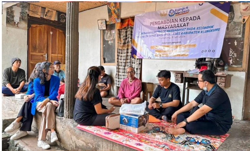
Gambar 2. Pemaparan solusi permasalahan mitra mengenai penyakit akibat kerja selama proses pembuatan kayu bubut.

lebih lanjut. Hasil evaluasi menunjukkan bahwa penggunaan APD meningkat dari 25% menjadi 70%, namun penting untuk memastikan bahwa penerapan ini dilakukan secara konsisten untuk meminimalisir risiko kesehatan dan kecelakaan di tempat kerja (Gambar 2).