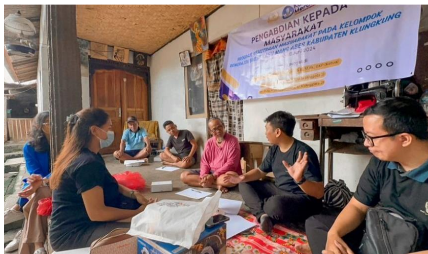
Gambar 3. Pemberian materi tentang bagaimana meningkatkan peningkatan kapasitas produksi dengan pengadaan alat-alat baru yang lebih efektif.

Ketiga, dari segi peningkatan kapasitas produksi, pengadaan alat baru seperti dinamo asah dan bor duduk memberikan dampak yang signifikan. Sebelum pengadaan alat, hanya 50% dari pengrajin yang mampu mencapai kapasitas produksi optimal, sementara setelah pengadaan alat baru, angka ini meningkat menjadi 90%. Ini sesuai dengan penelitian yang menunjukkan bahwa modernisasi alat dapat meningkatkan efisiensi produksi dan kualitas produk (Santiago & Estiningrum, 2021). Selain meningkatkan kuantitas, kualitas produk juga meningkat dari 55% menjadi 85%, dengan presisi yang lebih baik berkat penggunaan alat baru (Gambar 3).