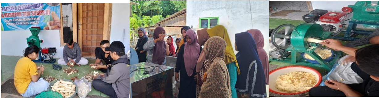
Gambar 5. Praktik Pembuatan Tepung Mocaf Menggunakan TTG

dengan menempelkan brand kelompok tani Subur III agar lebih dikenal dan memudahkan promosi produk.