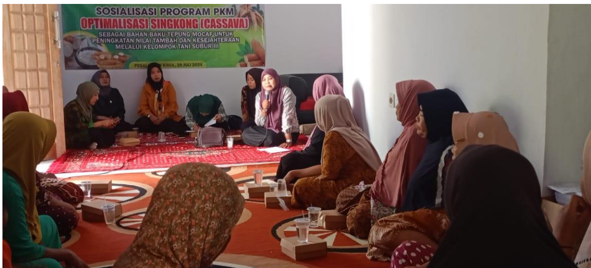
Gambar 3. Sosialisasi Program PKM

Sosialisasi ke mitra tentang kegiatan pengabdian dalam rangka peningkatan pemberdayaan, keterampilan, pengetahuan, dan penguasaan teknologi oleh mitra yang difasilitasi oleh Tim PKM. Kegiatan sosialisasi merupakan salah satu tahapan penting dalam menyampaikan program dan kegiatan PKM. Berangkat dari pendekatan andragogik, kegiatan sosialisasi fokus pada upaya mempersiapkan mitra belajar dan menyamakan persepsi dalam mencapai pemahaman bersama akan pentingnya program ini.