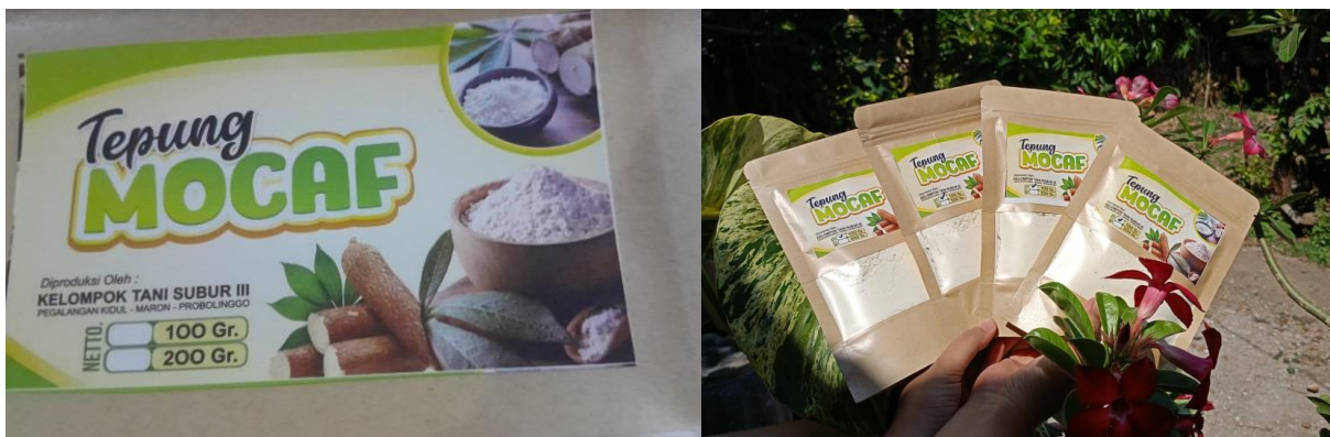
Gambar 6. Produksi Tepung Mocaf Kelompok Tani Subur III

Melalui kegiatan ini diharapkan membuka wawasan kelompok tani bahwa singkong dapat diolah menjadi bahan dasar pembuatan makanan lain sehingga lebih banyak variasi makanan yang dapat dibuat, selain itu tepung mocaf lebih tahan lama, dengan nilai jual yang lebih tinggi dari singkong mentah.