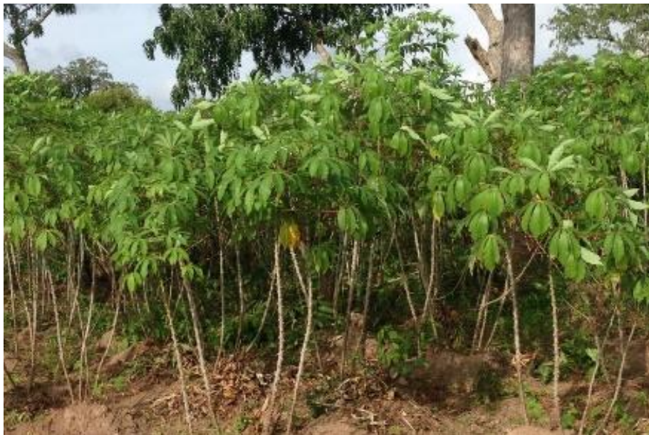
Gambar 1. Kebun Singkong Milik Warga Desa

Desa Pegalangan Kidul memiliki lahan perkebunan cukup luas. Warga setempat memanfaatkan lahan itu untuk menanam sejumlah pohon bernilai ekonomis. Bahkan jenis tanaman itu kini menjadi penopang perekonomian warga. Di desa tersebut luas panen singkong (Cassava) sebesar 2,068 hektar. Tanaman singkong menghiasi kebun-kebun warga. Tingkat permintaan atas singkong diprediksi akan semakin meningkat dengan adanya peningkatan penduduk dan industri olahan singkong. Singkong segar mempunyai komposisi kimiawi yang terdiri dari air (67,5%), karbohidrat (30,5%), amilum (25,5%), protein (1,3%), abu (1,2%), serat (0,3%), dan lemak (0,3%). Singkong dapat didiversifikasi menjadi berbagai produk seperti sayur, tepung tapioka, pemanis, keripik, bioetanol, dan mocaf.(Asmoro et al., 2021)