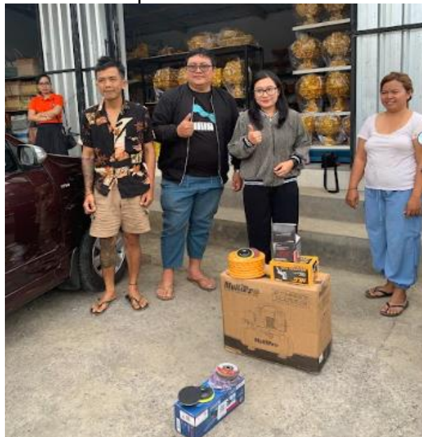
Gambar 4. Pemberian Alat Penunjang Produksi

Mengacu pada permasalahan yang disampaikan oleh mitra pada saat kegiatan survei salah satunya adalah kurangnya peralatan produksi yang memadai untuk pengembangan produk maka pada kegiatan pengabdian ini diberikan bantuan alat produksi. Hal ini sejalan dengan penelitian oleh (Mulawarman, 2022) dimana menggunakan mesin membuat kerajinan dulang lebih mudah diproduksi. Untuk itulah pengabdian ini membuat kegiatan dalam bentuk pemberian bantuan alat produksi berupa alat air compressor, spite sprayer dan mesin amplas yang diharapkan dapat meningkatkan kuantitas dan kualitas produksi.