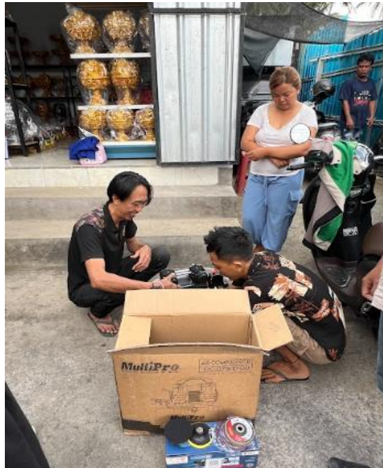
Gambar 5. Pelatihan Penggunaan Alat Produksi