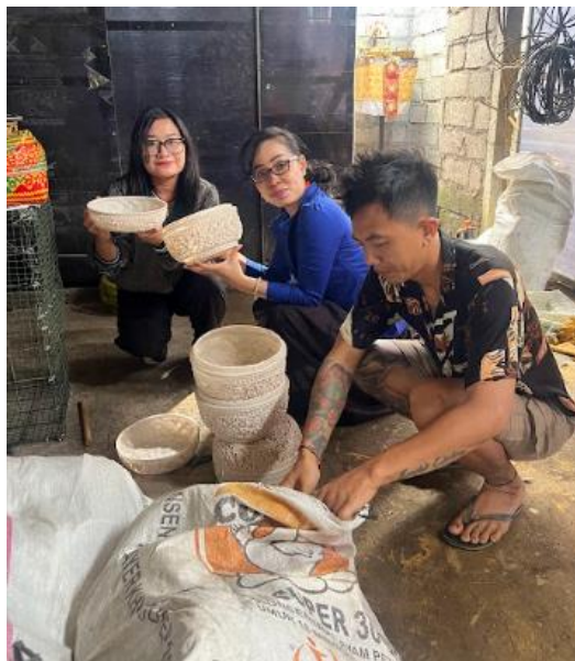
Gambar 6. Pelatihan K3

Penelitian oleh (Rusni et al., 2024) menyatakan bahwa pentingnya pelatihan K3 untuk usaha dulang fiber. Pelatihan K3 ini bertujuan untuk meminimalisir terjadinya kecelakaan kerja yaitu dengan cara berkerja secara disiplin dan hati-hati. Tentunya dalam produksi kerajinan dulang fiber menggunakan bahan-bahan kimia yang dapat mengganggu Kesehatan. Mengacu pada hal tersebut mitra pengabdian melakukan pelatihan K3 ini kepada mitra dengan cara memeberikan pemahaman mengenai kesehatan keselamatan kerja.