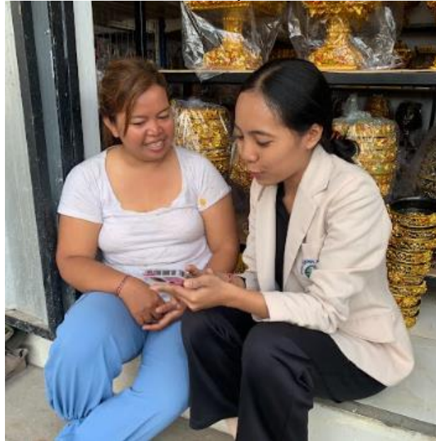
Gambar 7. Pelatihan Pemasaran Online

media pemasaran online berupa social media dan marketplace agar mitra dapat memasarkan produk secara online. Media online ini memudahkan kustomer mengetahui usaha mitra. Pelatihan ini memberikan penjelasan secara umum mengenai instagram dan praktek langsung mengenai tata cara akses sosial media serta pengisian content untuk memasarkan produk.