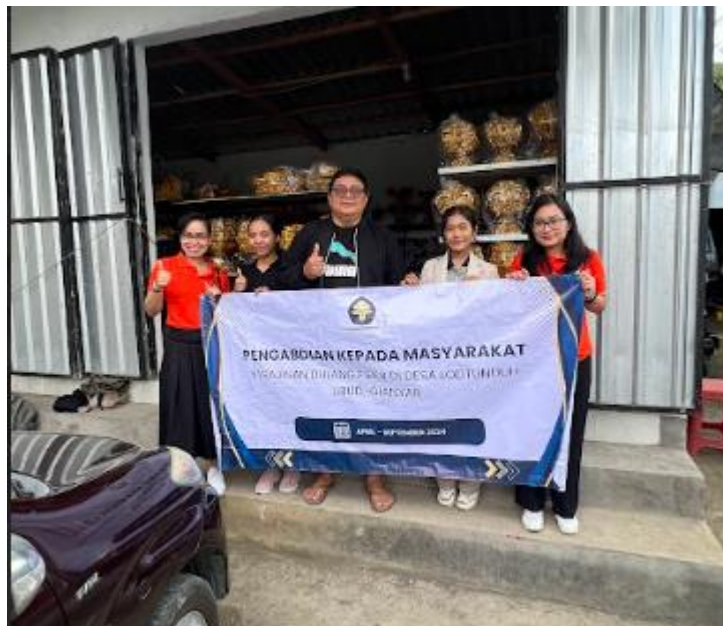
Gambar 2. Sosialisasi Kegiatan

Tim pengabdian melakukan sosialisasi kegiatan yang dilakukan terkait dengan tahapan serta target dari setiap kegiatan yang dilakukan, mendiskusikan jadwal kegiatan untuk tiap kegiatan serta persiapan alat dan bahan yang diperlukan untuk tiap kegiatan kepada mitra usaha kerajinan dulang fiber Asta Dala di Desa Lodontuh, Ubud, Gianyar.