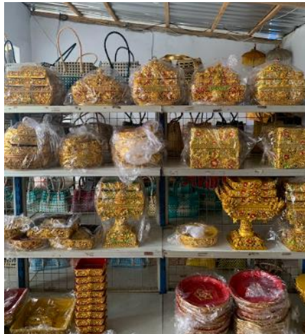
Gambar 3. Penataan Product Display

kerajinan sehingga tertata dengan rapi sehingga nampak lebih menarik dimata konsumen.