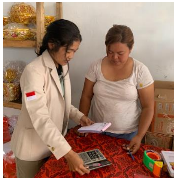
Gambar 8. Pelatihan Pembukuan Usaha

Dalam pengelolaan keuangannya mitra belum melakukan pembukuan terkait dengan uang masuk dan keluar sehingga diberikan pelatihan pembukuan usaha. Pelatihan ini terdiri dari pelatihan pencatatan nota dan order serta pencatatan pemasukan dan pengeluaran pada buku kas. Pelatihan pertama menjelaskan mengenai cara pencatatan pada nota apabila terdapat penjualan produk ataupun order dari pelanggan. Pelatihan kedua yaitu pencatatan buku kas, pada pelatihan ini mitra diberikan penjelasan terlebih dahulu mengenai komponen yang terdapat pada buku kas yaitu tanggal, keterangan, debit dan kredit.