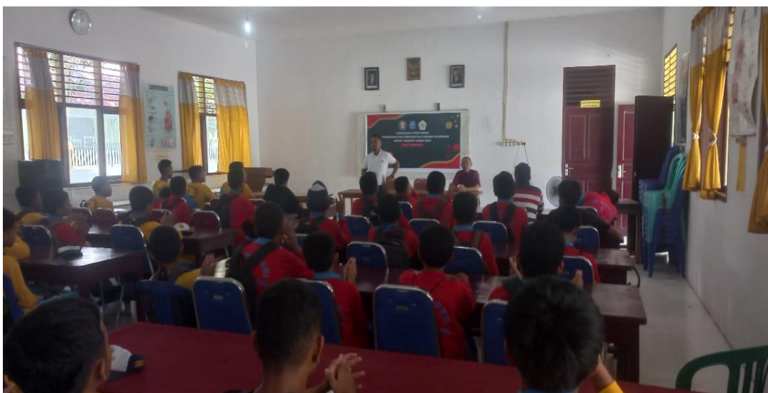
Gambar 1. Proses Pelaksanaan Sosialisasi Sepak Takraw

Hasil dari pelaksanaan sosialisasi peraturan pertandingan dan perwasitan cabang olahraga sepak takraw mencakup berbagai aspek yang menunjukkan sejauh mana kegiatan tersebut berhasil mencapai tujuan dan dampaknya terhadap peserta serta olahraga yaitu sebagian besar peserta menunjukkan peningkatan pemahaman tentang peraturan pertandingan dan teknik perwasitan, berdasarkan hasil tes atau evaluasi pasca-pelatihan. Wasit yang mengikuti pelatihan menunjukkan peningkatan keterampilan dalam pengambilan keputusan yang adil dan konsisten selama pertandingan. Materi sosialisasi dianggap relevan dan bermanfaat oleh sebagian besar peserta. Panduan peraturan, video tutorial, dan infografis yang digunakan dinilai efektif dalam menyampaikan informasi. Metode pelatihan yang melibatkan sesi teori dan praktik diakui efektif. Sesi simulasi pertandingan memungkinkan peserta untuk mempraktikkan pengetahuan mereka secara langsung.