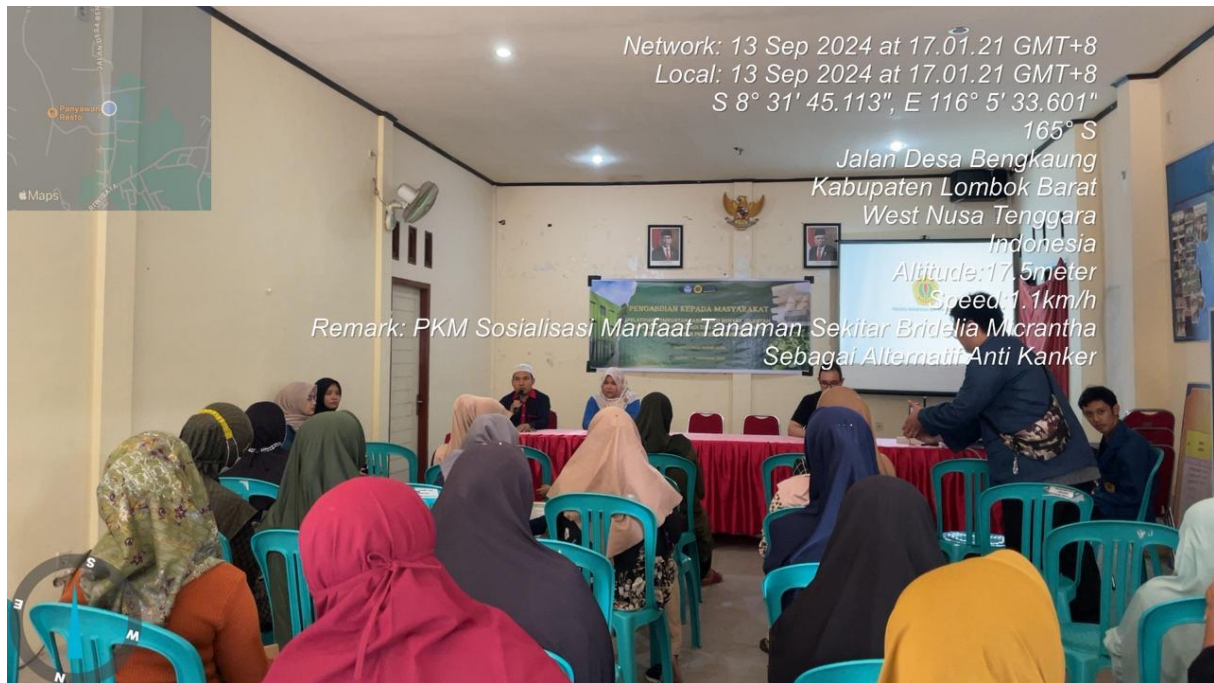
Gambar 2. Pemaparan materi tanaman obat Desa Bengkaung dan Teknik ethno-ekstraksi.

Kerusakan Kulit, dan Penyakit Paru-paru. TIM pengabdian juga memberikan penekanan pada pentingnya gaya hidup sehat. Penting untuk diingat bahwa radikal bebas juga dihasilkan secara alami dalam tubuh melalui proses metabolisme normal, tetapi paparan berlebihan (misalnya melalui polusi, konsumsi alkohol berlebihan, merokok, atau diet tidak sehat) dapat menyebabkan stres oksidatif yang merusak kesehatan tubuh dan berkontribusi pada berbagai penyakit di atas. Proses pemaparan materi pada ibu PKK dapat dilihat pada Gambar 1.