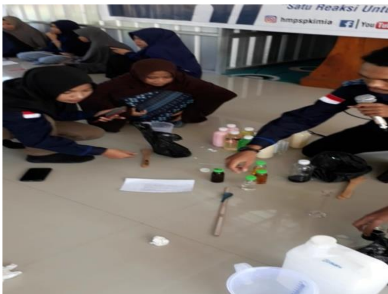
Gambar 2. Kegiatan proses pembimbingan pembuatan sabun cair

Respon peserta dengan adanya kegiatan pelatihan sangat baik, dengan indikator peserta antusias dan semangat mengikuti setiap sesi pelatihan selain itu setiap peserta dapat mengetahui dan memahami formula setiap bahan yang digunakan serta langkah-langkah pembuatan produk berupa sabun dan pewangi pakaian.